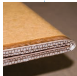
Sargens nedre kant är försedd med vax som gör wellpappen motståndskraftig mot fukt.