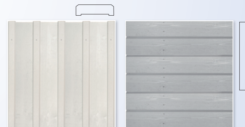
Bergslagspanel Råplan klyv med fasläkt