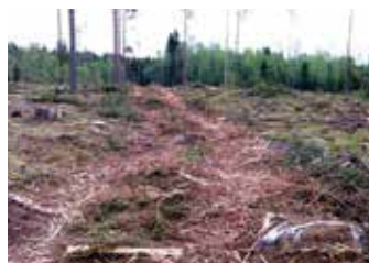
Avverkat enligt ”Den rätta vägen”